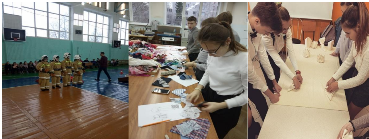
Рисунок 2. Фото участников проекта «Билет в будущее»

Профессиональные пробы становятся для участников проверкой выбранной профессиональной траектории. Они помогают оценить степень развития знаний, умений и навыков и в целом готовность к переходу на более высокий этап профессионального становления – участие в конкурсах профессионального мастерства, обучение в профильном классе, поступление в учебное заведение профессионального образования и т.д.