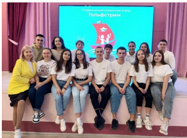
Рисунок 4. Фото «Отряд «Гольфстрим»»

Студенты, входящие в состав ССервО «Гольфстрим», ежегодно выезжают на трудовые проекты таких масштабных предприятий как «Ялта-Интурист» и «Мрия Резорт & СПА». Также бойцы отряда «Гольфстрим» работают на объектах Чувашии, например, «Апарт-Отель «Республика».