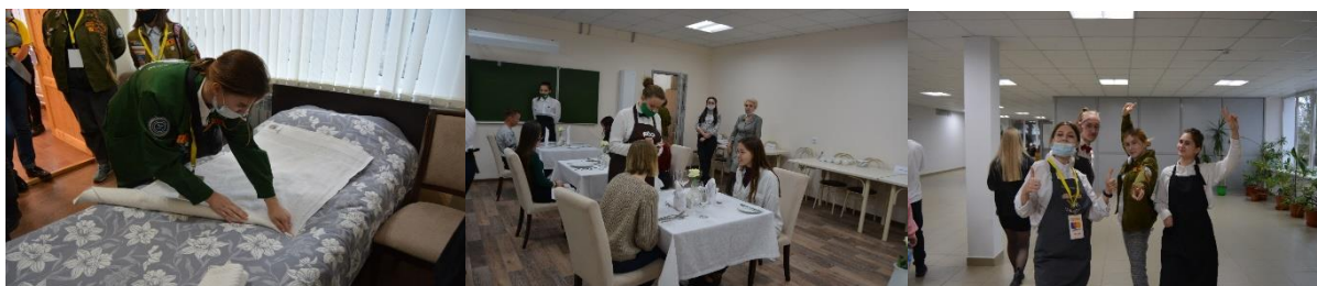
Рисунок 5. Фото «Конкурс профессионального мастерства»

Конечно, ребята не только работают, но и активно принимают участие в конкурсах профессионального мастерства. В рамках проведения слета трудовых отрядов Приволжского федерального округа в 2021 году Колледж стал площадкой для проведения конкурсов профессионального мастерства по профессиям «Горничная» и «Официант», а также на базе нашего колледжа прошёл творческий этап конкурса.