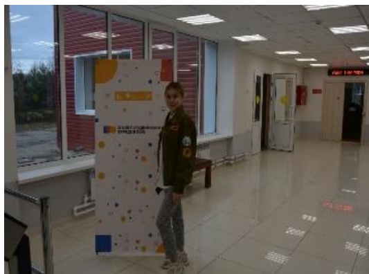
Рисунок 1. Фото участника трудового проекта «Российские студенческие отряды»

занимает участие студентов в трудовых проектах Российских студенческих отрядов.