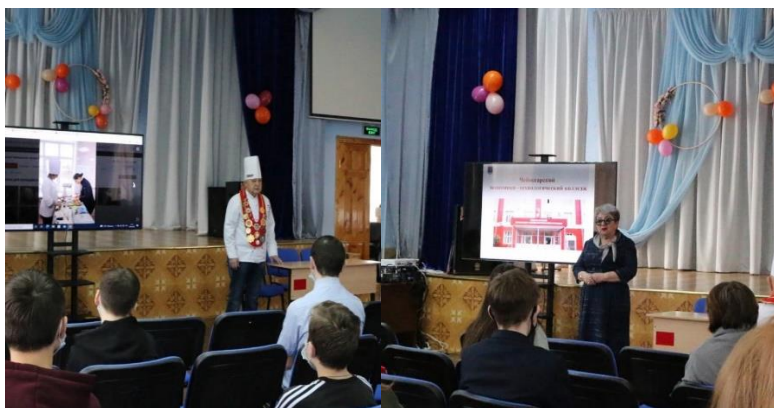
Рисунок 3. Фото «Встреча с социальными партнерами»

Содействие в трудоустройстве выпускников - одно из важнейших направлений деятельности Колледжа. Реализуемая в Колледже система партнерства с предприятиями расширяет возможности для организации практической подготовки студентов, трудоустройства выпускников, дает информацию о рынке труда, позволяет разрабатывать и реализовывать совместные проекты.